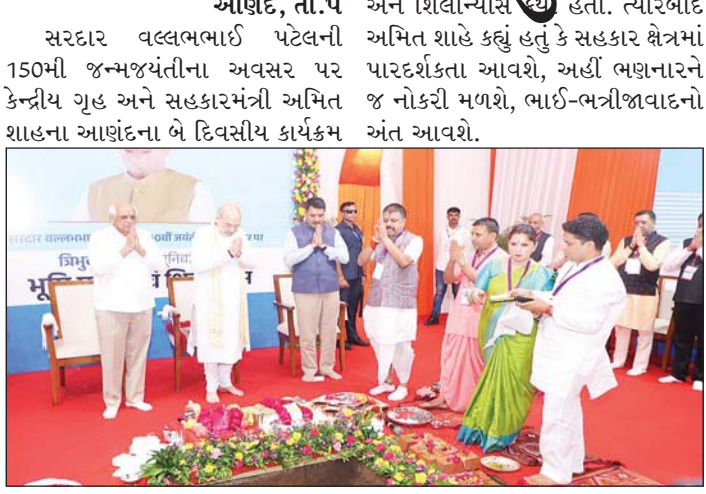
આણંદ, તા.૫ સરદાર વલ્લભભાઈ પટેલની 150મી જન્મજયંતીના અવસર પર કેન્દ્રીય ગૃહ અને સહકારમંત્રી અમિત શાહના આણંદના બે દિવસીય કાર્યક્રમ અંતર્ગત આજીવન સહકારી યુનિવર્સિટીનું ભૂમિપૂજન કરવામાં આવ્યું હતું.

આણંદ, તા.૫ મુખ્યમંત્રી ભૂપેન્દ્ર પટેલે આ પ્રસંગે જણાવ્યું કે, આજનો આંતરરાષ્ટ્રીય સહકારી દિવસના પાવન અવસરે ત્રિભુવન સહકારી યુનિવર્સિટીના નિર્માણ માટેના ખાતમુહૂર્તનો ઐતિહાસિક પ્રસંગ આણંદની ધરતી પર ઉજવાયો છે. જે ભારતના સહકારી ઇતિહાસમાં એક મહત્વપૂર્ણ સિદ્ધિ રૂપ છે. આ યુનિવર્સિટી દેશની પ્રથમ સહકારી યુનિવર્સિટી તરીકે સહકાર ક્ષેત્રમાં નવા યુગની શરૂઆત કરશે. આ ઉત્કૃષ્ટ પહેલથી સહકારી વડાપ્રધાન નરેન્દ્ર મોદીએ 'સહકારથી સમૃદ્ધિ'ના મંત્ર સાથે સહકાર ક્ષેત્રને વિકાસની મુખ્યધારામાં લાવ્યું: CM