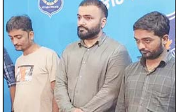
ઓફિસ ખોલીને મોટાપાયે ચાલતાં શેર ટ્રેડિંગના એક રેકેટને સાયબર કાર્ઠમ પોલીસની ટીમે શોધી કાઢીને

સુરત, તા.૫ દુબઈ, રાજકોટ અને ઉત્તરાખતના પ્રગતિ આઈટી પાર્કમાં