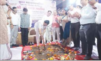
૧૩૧૨ ટેનામેન્ટ, ફાયર સ્ટેશન, ન.પ્રા.શાળા તેમજ આંગણવાડી સહિતના નવીનીકરણના કામોનું આતમહુર્ત કર્યું હતું. રાજ્ય સરકારની જાહેર આવાસોના પુન:વિકાસ યોજના અંતર્ગત માન દરવાજા ખાતે

સુરત, તા.૫ કેન્દ્રીય જળશક્તિ મંત્રી સી.આર. પાટીલે સુરતના માનદરવાજા ખાતે